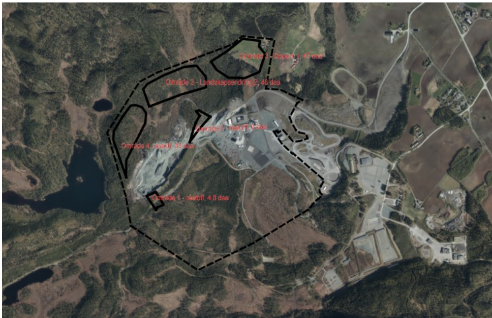
Bildet viser hvor forslagsstiller ønsker å regulere/omregulere forskjellige formål

Område 1 og 2 (se bildet over): Bakgrunn for endring og detaljering av gjeldende plan 2-046 er både at planen stiller krav om detaljregulering før utbygging, og at den ikke er optimal med tanke på transport og lagring av masser, og det ønskes en mer effektiv og formålstjenlig utnyttning av