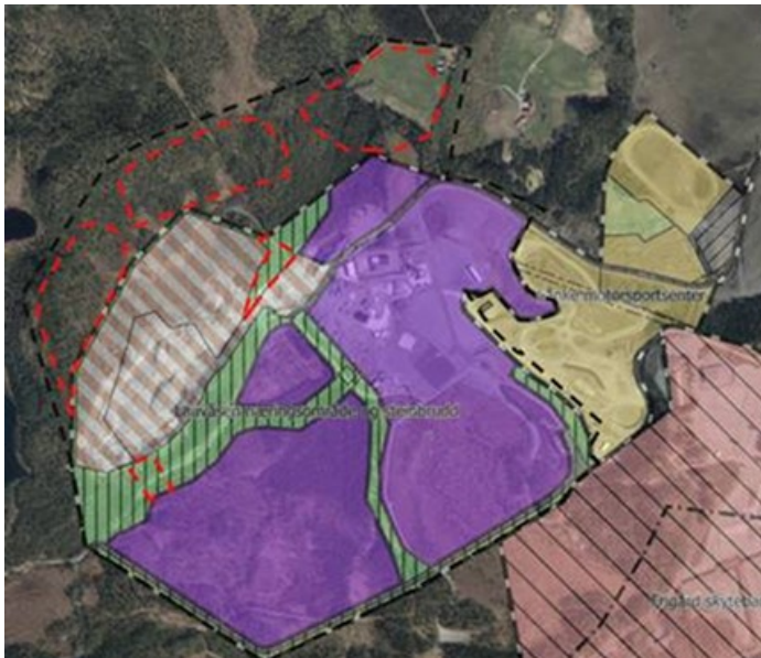
Plangrensen omfatter planID 2-046 og utvidelse på nordsiden