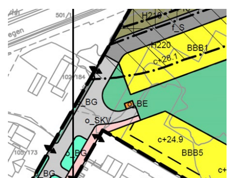
Utklipp av forslag til planendring. Kartet viser ny plassering av energianlegg (o_BE), justert utforming av snuplass og fortau.