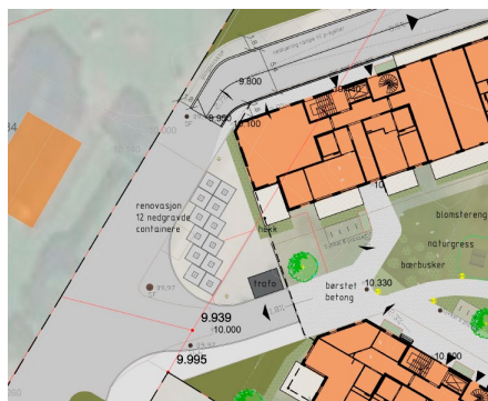
Utklipp av godkjent utomhusplan til byggesaken som viser endret plassering av energianlegg og renovasjon. (Innvilget gjennom dispensasjon).