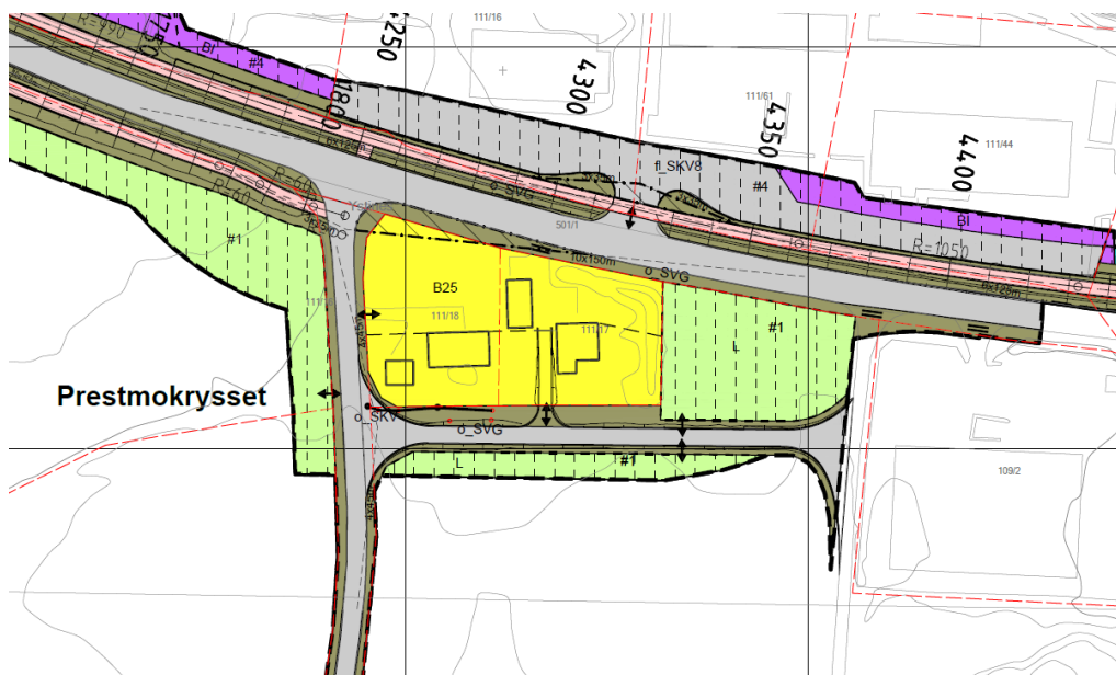
Figur 3 viser foreslått planendring.