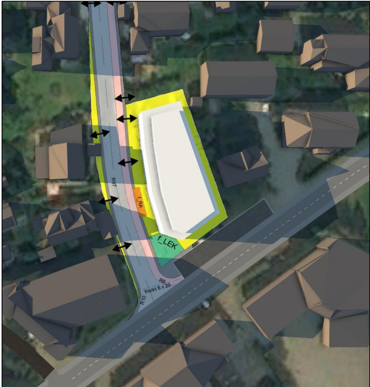
Figur 2.5: 18.00.