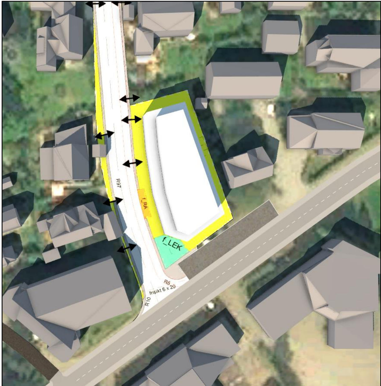
Figur 2.3: 14.00.