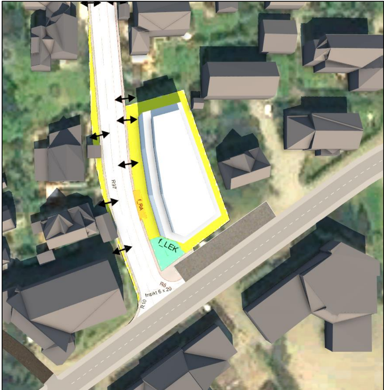
Figur 2.2: Kl. 12.00