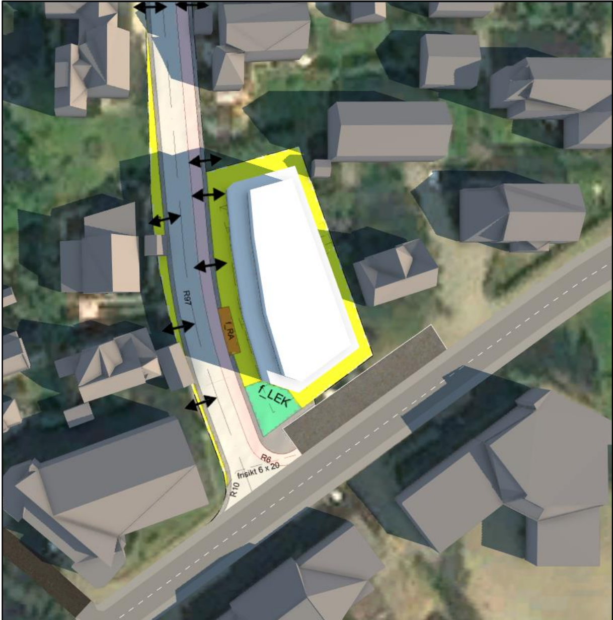
Figur 2.1: Kl. 08.00.

Her vises solforholdene i området ved en utnyttelse av eiendommen på om lag 130 % BRA, dvs. omtrent 1100 kvm, kl. 08.00 (øverst), 12.00, 14.00, 16.00 og kl. 18.00.