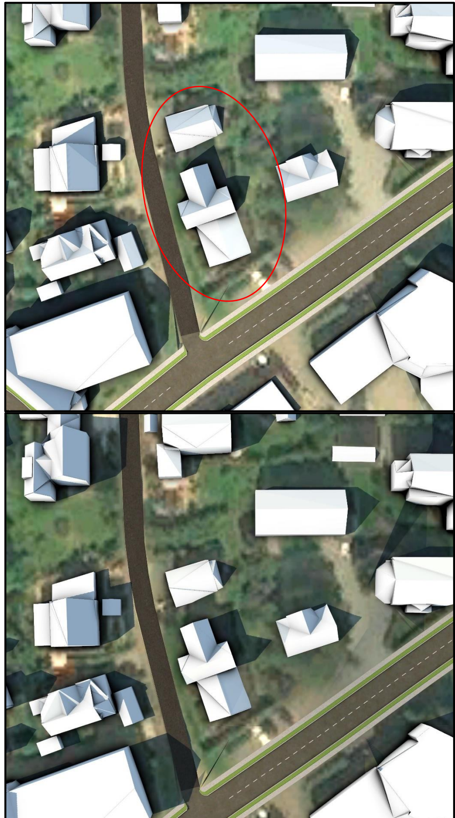
Figur 1.1: kl. 14 (øverst) og kl. 16 1. mai.

Her vises situasjonen som den er på eiendommen pr. dags dato. Eksisterende bebyggelse markert i rødt.