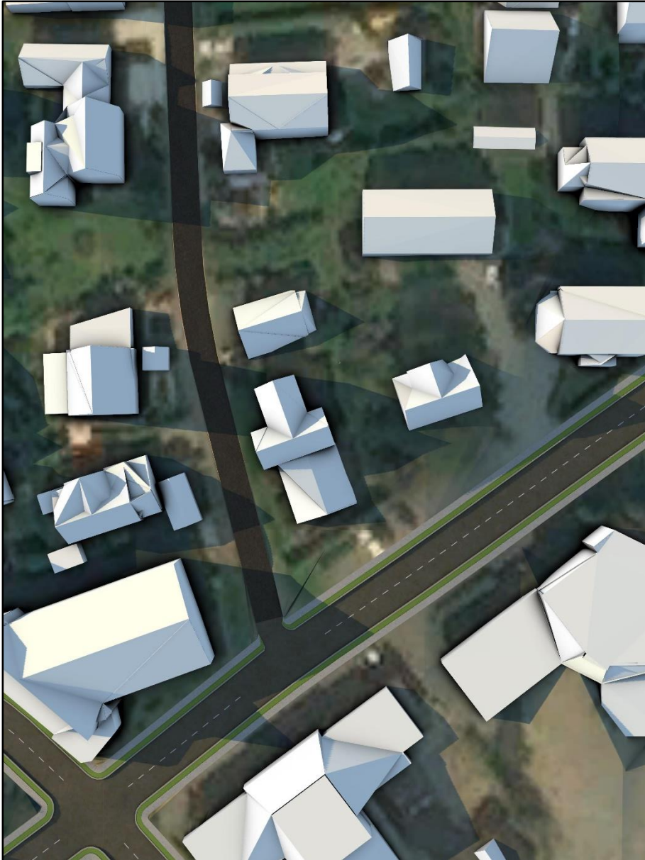
Figur 1.2: kl. 18 1. mai.